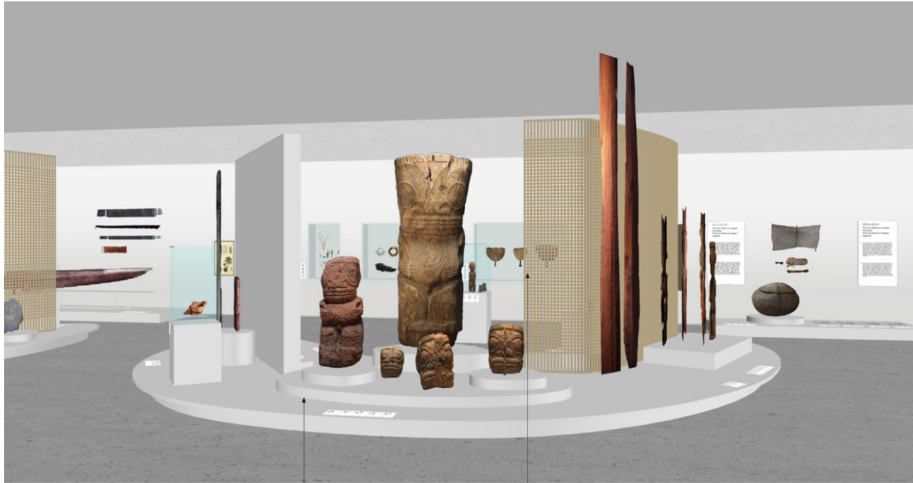
Plateforme : Marquises