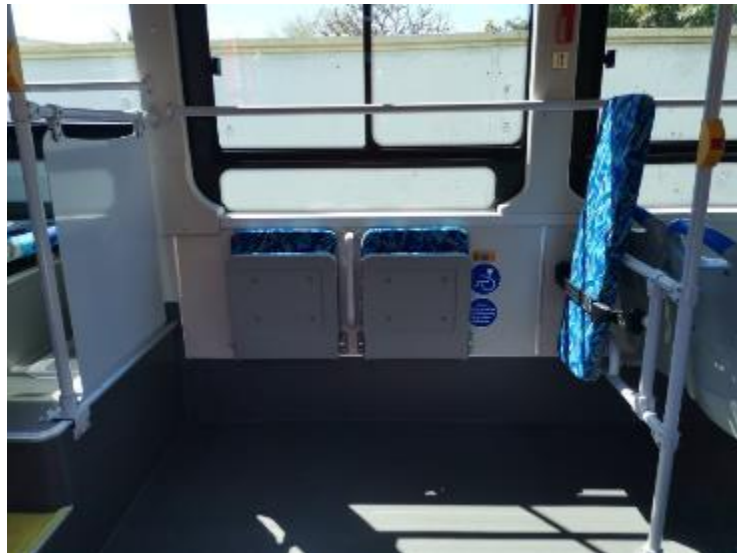
Aire réservée aux usagers en fauteuil roulant