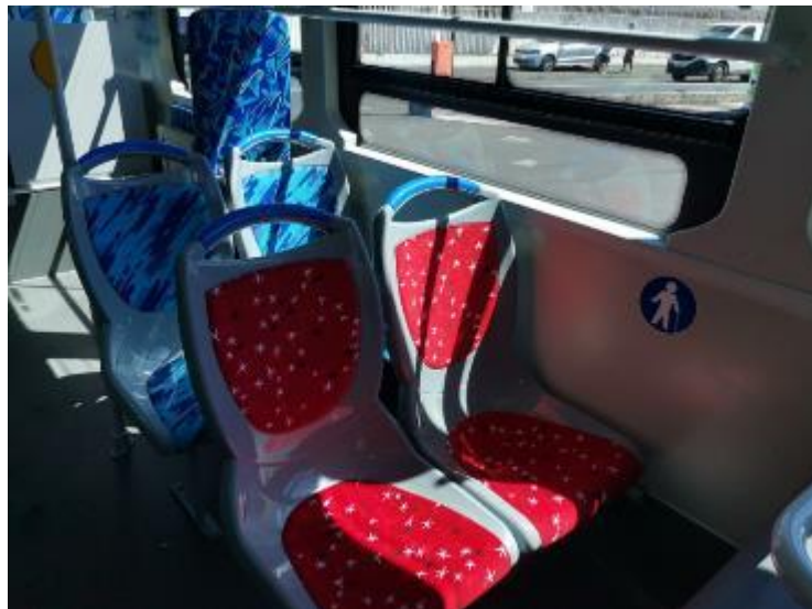
En rouge, des sièges de courtoisie à céder en priorité aux personnes à mobilité réduite (personnes handicapées, matahiapo, femmes enceintes...)