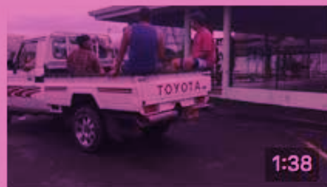
Catégorie individuel - Vidéo n°18 : Mihiau 29 K vues · 13 novembre